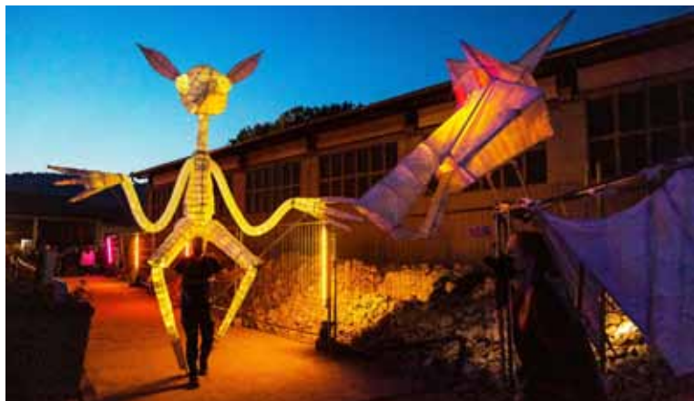
PI Kevelaer im Licht Walk Acts

Eine faszinierende und kostenfreie 3D-Videoprojektion in der St. Antonius-Kirche sowie illuminierte Fassaden und Sehenswürdigkeiten, beleuchtete Walk Acts und Schaufensterinstallationen in der Innenstadt warten darauf, von Kevelaerern und Gästen entdeckt zu werden.