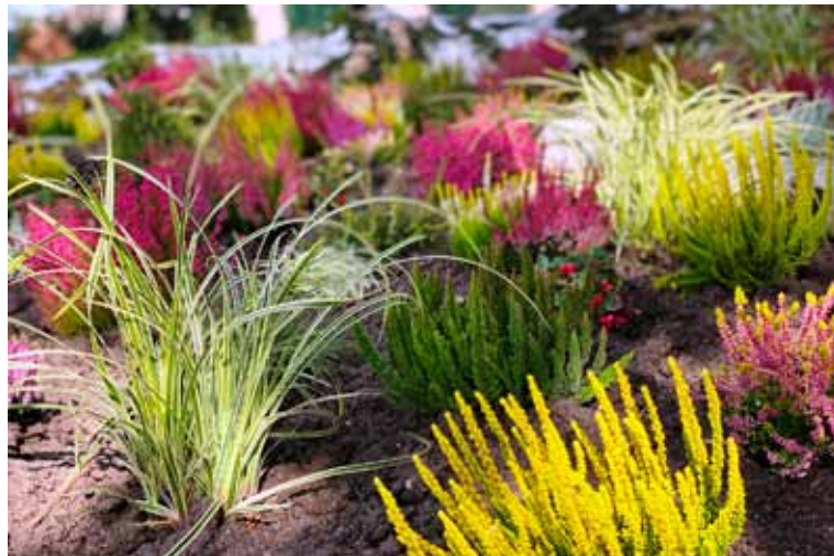
PI Kevelaer blüht auf Herbst lang

Das Figurentheater Jena mit ihrem Walk Act „Ulumasi Gantela“, einer Performance beleuchteter Großspinnen, startet jeweils um 18 Uhr am Museums-Vorplatz.