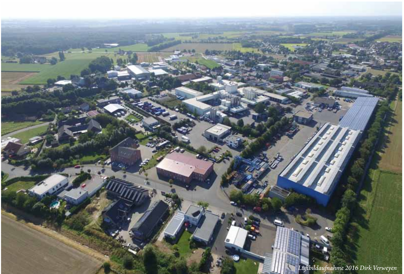
Luftbildaufnahme 2016 Dirk Verweyen

was aufzubauen. Das Miteinander der Betriebe, die hier schon länger angesiedelt sind und da besonders die Unterstützung der ortsansässigen Vereine sind vorbildlich.