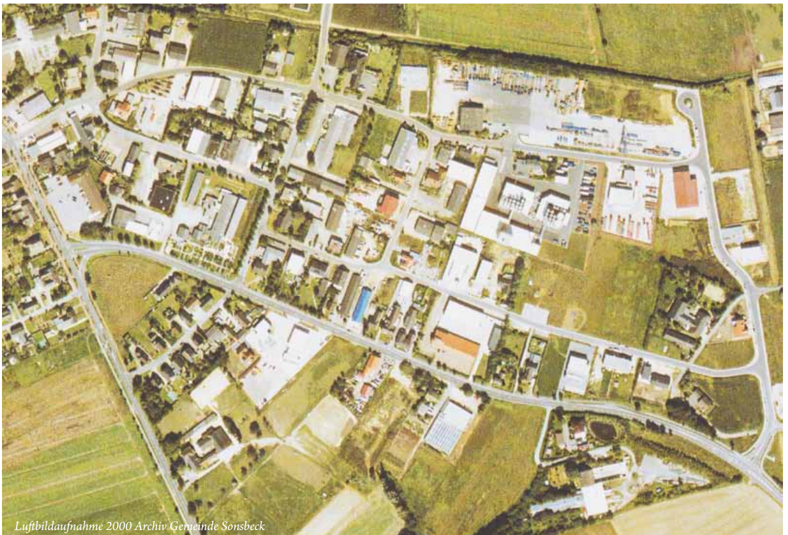
Luftbildaufnahme 2000