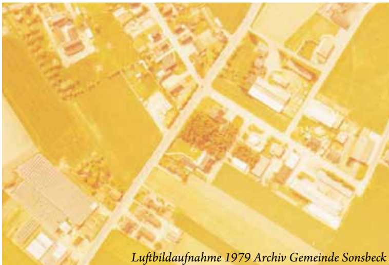
Luftbildaufnahme 1979