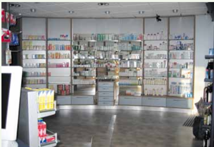
Firmenvorstellung Adler Apotheke