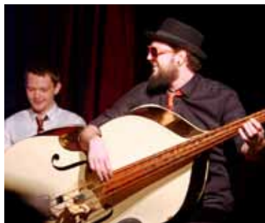
Der Bassist von Rockameier gab seinem Instrument ordentlich „Kontra“