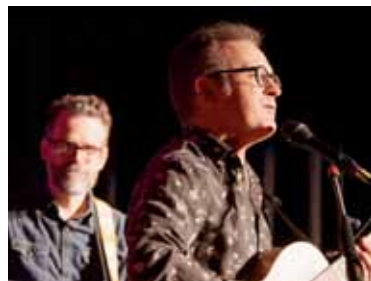
Udo Klopke spielte unter viel Beifall viele Songs seines aktuellen Albums „Make me an offer“